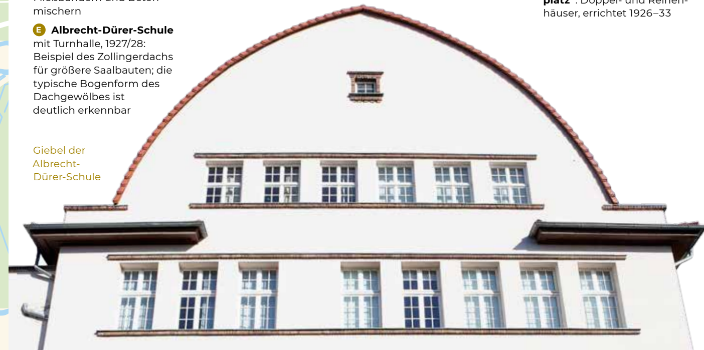
Giebel der Albrecht-Dürer-Schule

10 Siedlung „Exerzierplatz“: Doppel- und Reihenhäuser, errichtet 1926–33